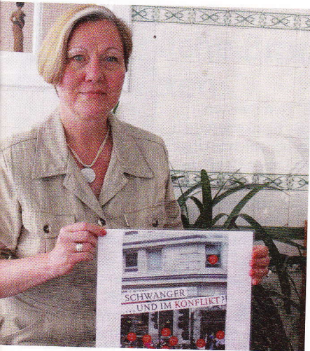
Frau Herling: „Jede familiäre Krise ist zu meistern!“